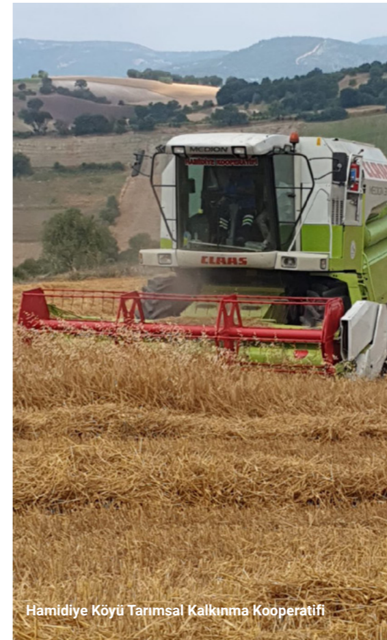
Hamidiye Köyü Tarımsal Kalkınma Kooperatifi