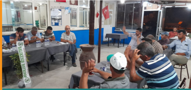
Şamlı Beldesi T.K.K.