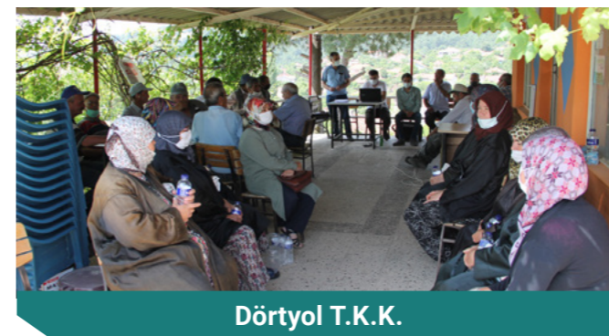
Dört Yol T.K.K.