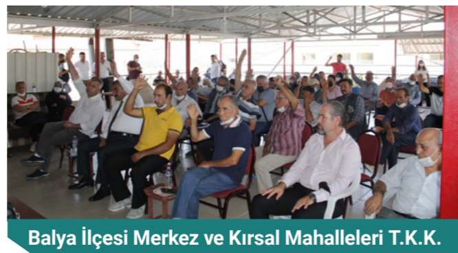
Balya İlçesi Merkez ve Kırsal Mahalleleri T.K.K.