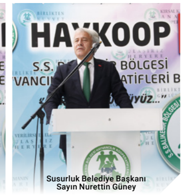
Susurluk Belediye Başkanı Sayın Nurettin Güney