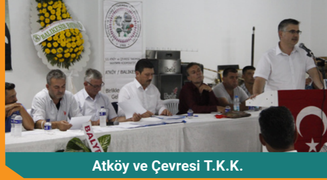
Atköy ve Çevresi T.K.K.

Genel Kurullara katılan yönetim kurulu üyelerimiz kooperatiflerimizin ortaklarıyla görüşme imkanı bulup aynı zamanda divan heyetinde de yer alarak genel kurulların nizamî şekilde icra edilmesinde katkı sağladılar. Yönetimi değişen kooperatiflerimizin yeni yönetim kurulu üyelerine başarılar diler, aldıkları kararların kooperatiflerimize hayırlı olmasını dileriz.