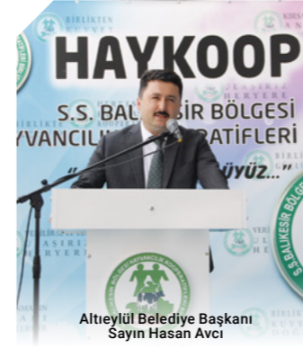
Altıeylül Belediye Başkanı Sayın Hasan Avcı