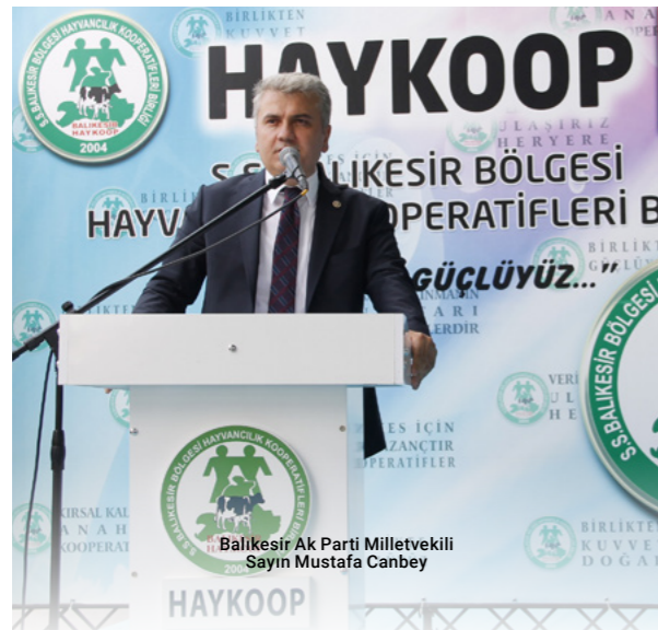
Balıkesir Ak Parti Milletvekili Sayın Mustafa Canbey