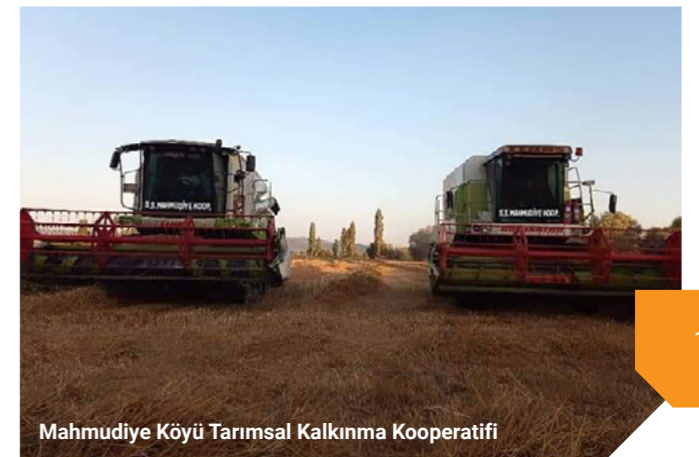
Mahmudiye Köyü Tarımsal Kalkınma Kooperatifi