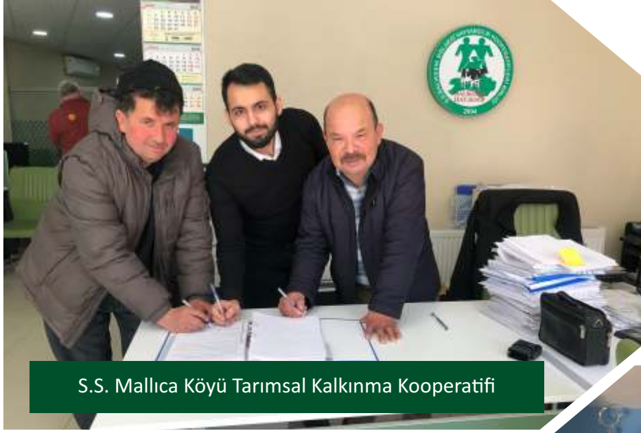
S.S. Mallica Köyü Tarımsal Kalkınma Kooperatifi

süre 2027 yılına kadar uzatıldı. Önümüzdeki dönemde de Makine Parklarını da içeren %65 hibeli çağrılarla tekrar kooperatiflerimiz bu hibe desteğinden yararlanabilecek.