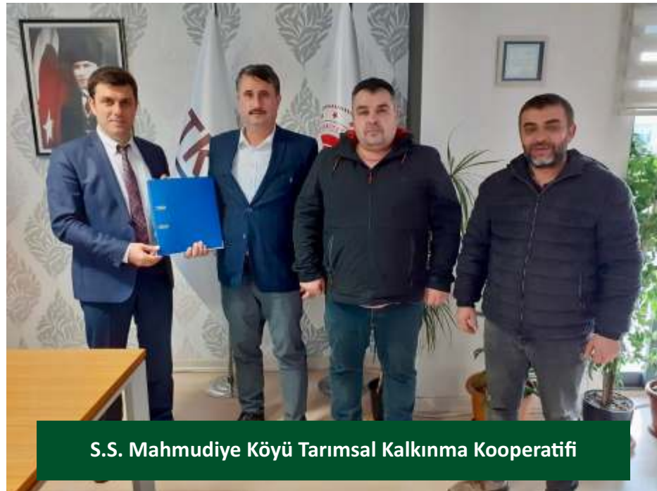
S.S. Mahmudiye Köyü Tarımsal Kalkınma Kooperatifi