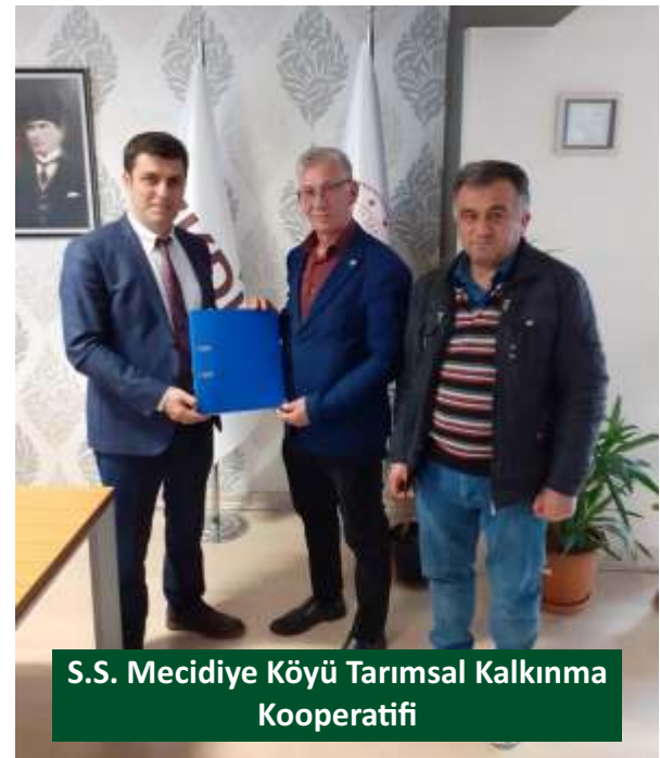
S.S. Mecidiye Köyü Tarımsal Kalkınma Kooperatifi