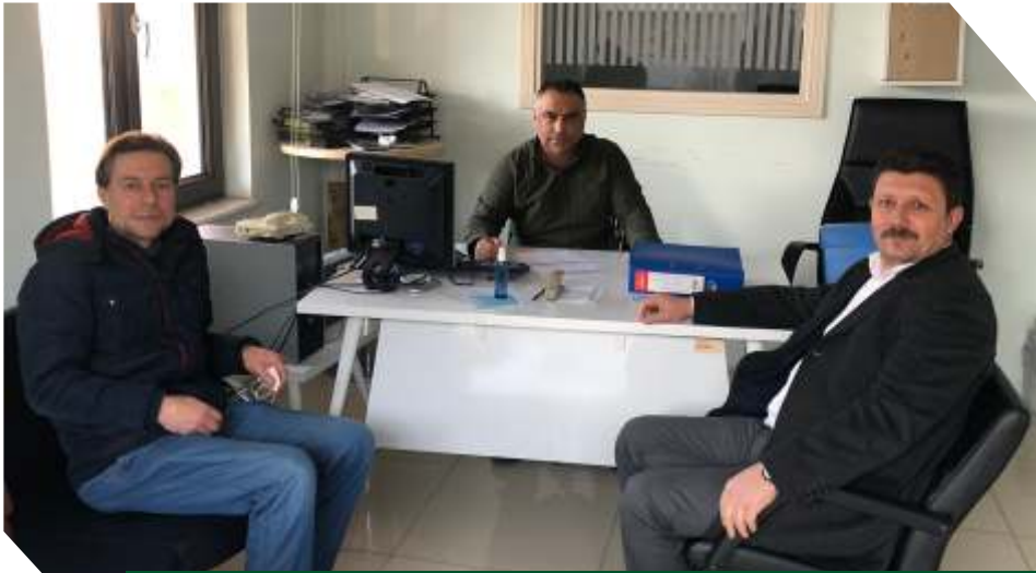
S.S. Atköy ve Çevresi Tarımsal Kalkınma Kooperatifi

TKDK'nın sağladığı %65 hibe desteği ile kurulması planlanan yeni makine parkları ve daha önceden hibeden yararlanmış kooperatiflerimizin makine