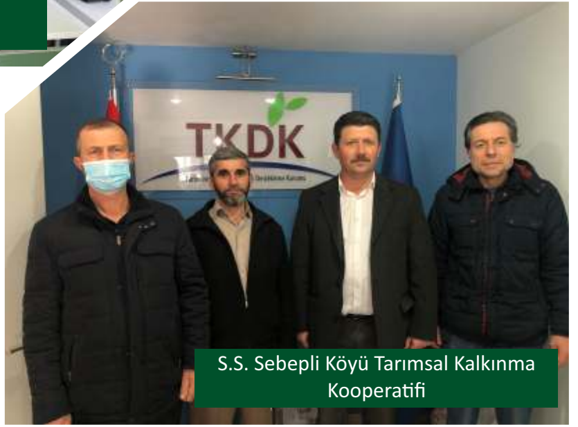
S.S. Sebepli Köyü Tarımsal Kalkınma Kooperatifi

TKDK %65 hibeli makine parkları için önümüzdeki dönemde başvurmayı düşünen kooperatiflerimize müjde. IPARD III programı ile