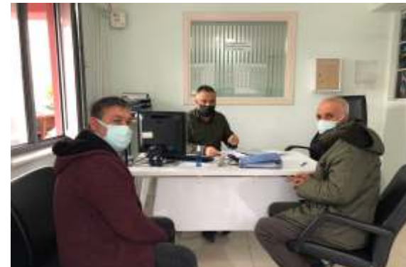
S.S. Çukuroba Köyü Tarımsal Kalkınma Kooperatifi