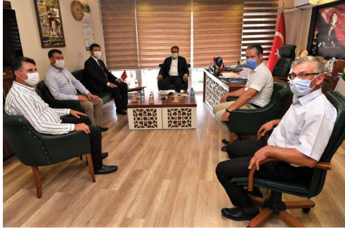
Balıkesir Valisi Sayın Hasan Şıldak'ın Birliğimize ziyareti