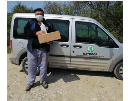
S.S. Yeniköy Tarımsal Kalkınma Kooperatifi