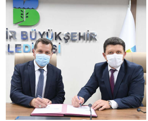
Balıkesir Büyükşehir Belediye Başkanı Sayın Yücel Yılmaz'a ziyaretimiz