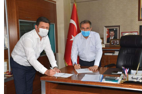
Bigadiç Belediye Başkanı Sayın İsmail Avcu'ya ziyaretimiz