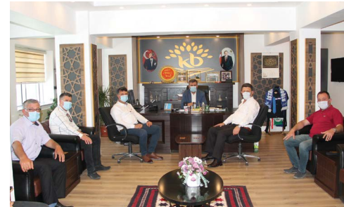
Kepsut Belediye Başkanı Sayın İsmail Cankul'a ziyaretimiz