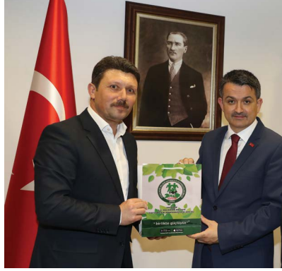
Tarım ve Orman Bakanı Sayın Bekir Pakdemirli'ye ziyaretimiz

Kooperatiflerimizin ve çiftçilerimizin menfaatlerini ve haklarını her daim savunmaktadır.