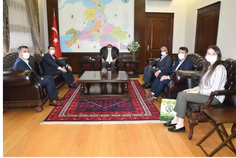
Balıkesir Valisi Sayın Hasan Şıldak'a hayırlı olsun ziyaretimiz