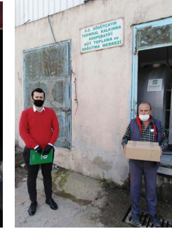
S.S. Söğütçayır Tarımsal Kalkınma Kooperatifi