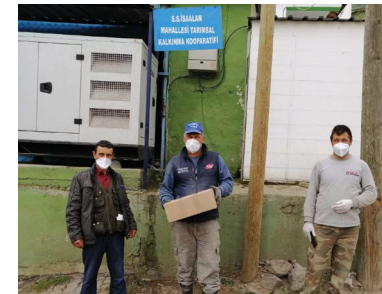
S.S. İsaalan Tarımsal Kalkınma Kooperatifi