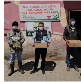
S.S. Doğanlar Tarımsal Kalkınma Kooperatifi