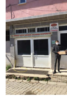
S.S. Bözreli Tarımsal Kalkınma Kooperatifi