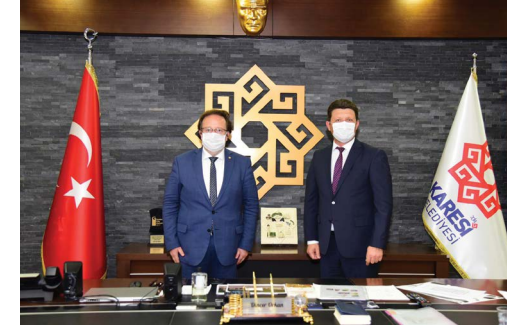
Karesi Belediye Başkanı Sayın Dinçer Orkan'a ziyaretimiz