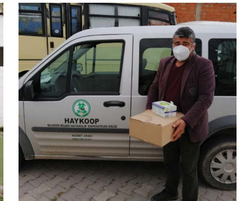
S.S. Osmaniye Tarımsal Kalkınma Kooperatifi