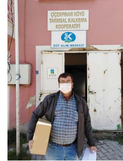
S.S. Çiçekpınar Tarımsal Kalkınma Kooperatifi

Dünya Sağlık Örgütü (WHO) tarafından koronavirüs salgını "pandemik bir salgın" olarak ilan edilmesinden sonra koronavirüs salgını ile mücadele için Balıkesir Büyükşehir Belediyesi'nin de katkılarıyla kooperatiflerimize koruyucu malzeme dağıttık.