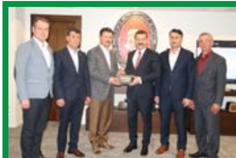
Büyükşehir Belediye Başkanı Sayın Yücel Yılmaz'a hayırlı olsun ziyaretimiz