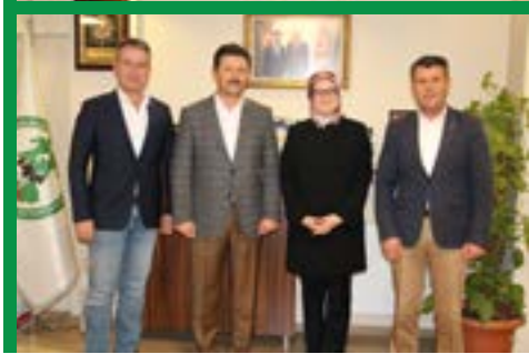
Adalet ve Kalkınma Partisi Balıkesir Milletvekili Sayın Belgin Gökçe Uygur'un Birligimize ziyareti

Özellikle son yıllarda kooperatiflere yapılan birebir ziyaretler ve kooperatif genel kurullarına katılım ile onların sorunlarını tespit etme ve gerekli çözümler bulma konusunda çalışmalar yoğun bir şekilde devam etmektedir.