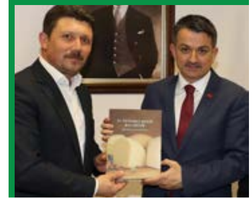
Tarım ve Orman Bakanı Sayın Bekir Pakde- mirli'ye ziyaretimiz