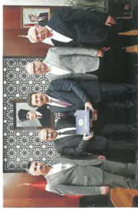
Balıkesir Valisi Sayın İsmail Ustaoglu'na ziyaretimiz