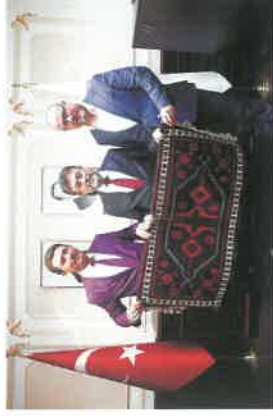
Tarım ve Orman Bakanı Sayın İbrahim Yumaklı'ya ziyaretimiz