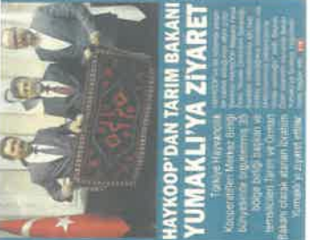
HAYKOOP'DAN TARIM BAKANI YUMAKLI'YA ZİYARET Türkiye Hayvancılık Kooperatifleri Birliği Başkanı Faruk Özen, Tarım ve Orman Bakanı Yumaklı'yı ziyaret etti. Özen, Bakanlıkça düzenlenen toplantıya katıldı. Toplantıda, hayvancılık sektöründe faaliyet gösteren hayvan yetiştiricilerinin sorunları konuşuldu.