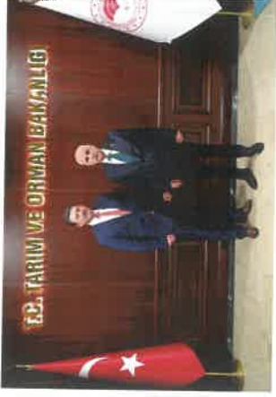
Tarım ve Orman Bakanı Sayın Prof. Dr. Vahit Kirişçi'ye ziyaretimiz