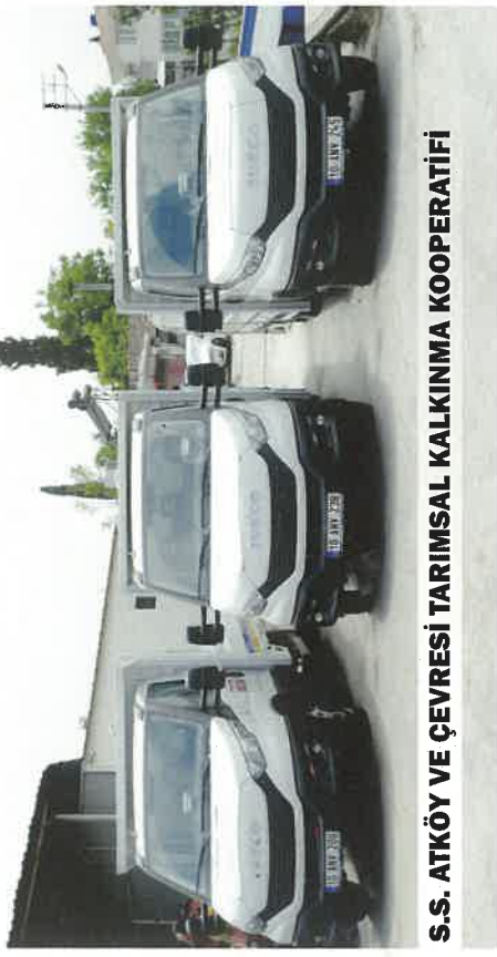
S.S. ATKÖY VE ÇEVRESİ TARIMSAL KALKINMA KOOPERATİFİ

Balıkesir HAYKOOP olarak 2024 yılında da proje danışmanlık yaparak ortak kooperatiflerimizin ihtiyacı olan makine, ekipman ve diğer ihtiyaçlarını hibeli olarak almalarına öncülük etti.