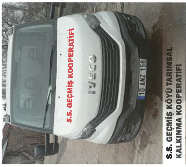
S.S. GEÇMİŞ KÖYÜ TARIMSAL KALKINMA KOOPERATİFİ

Tarım ve Kırsal Kalkınma Destekleme Kurumundan % 60 hibeyle S.S. Atköy ve Çevresi Tarımsal Kalkınma Kooperatifi 4 milyon TL tutarında 3 adet, S. S. Geçmiş Köyü Tarımsal Kalkınma Kooperatifi ise 1 milyon 226 bin 130 TL tutarında 1 adet süt toplama aracı satın almışlardır.